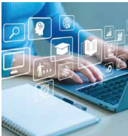
Más oportunidades educativas