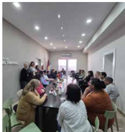
Primeros certificados de la Escuela de Manejo